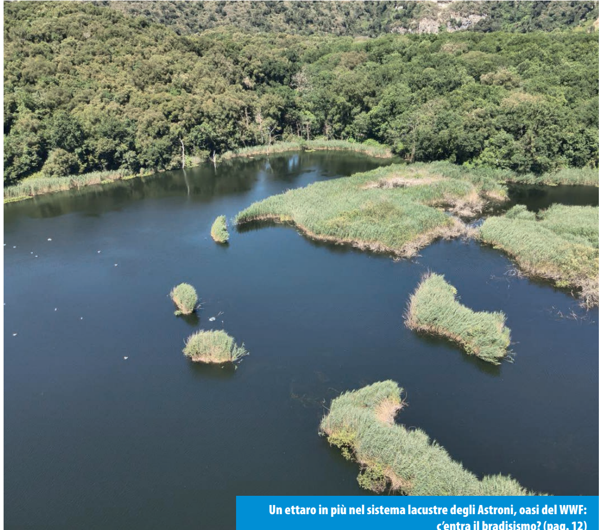
Un ettaro in più nel sistema lacustre degli Astroni, oasi del WWF: c'entra il bradismo? (pag. 12)