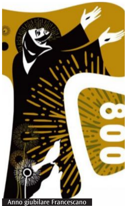
Anno giubilare Franciscano