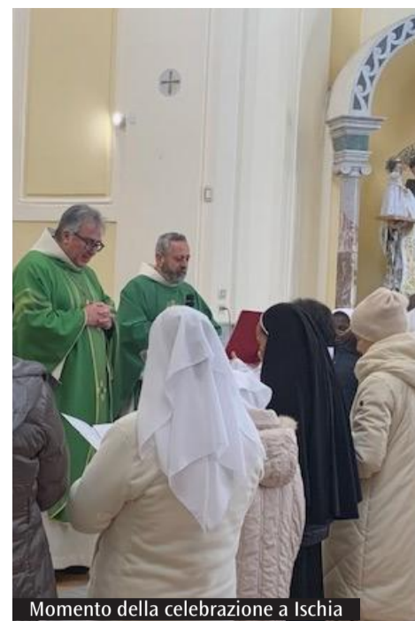
Momento della celebrazione a Ischia

cui ha chiesto di cominciare questa avventura, fidandosi della piezza che sentiva, pensando alla consacrazione e rimanendo nella gioia che provava nella preghiera con la Parola. Anche a noi laici toccano compiti specifici. In primo luogo, custodire, avere a cuore e incoraggiare sempre i nostri fratelli consacrati, in secondo luogo essere grati a Dio per il dono della loro presenza tra noi e prendere coscienza che ogni cristiano può essere, anzi è chiamato a essere, un segno eloquente di dedizione a Dio e di servizio ai fratelli, capace di illuminare il cammino delle comunità cristiane e di offrire una testimonianza credibile di speranza nel tempo presente, attraverso l'incarnazione quotidiana della Parola di Dio.