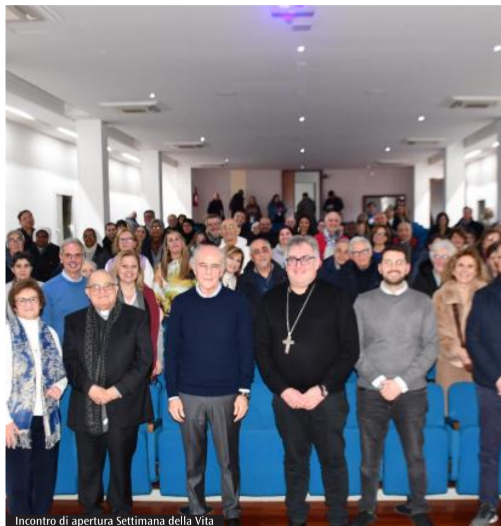
Incontro di apertura Settimana della Vita

dell'incontro con la fragilità e si inizia ad ascoltarla, attraversando quelle periferie non geografiche ma umane fatte di assenza di relazioni e di riconoscimento del limite. Fatta questa scelta di accettazione dei propri limiti e del diverso dell'altro, consapevoli che la fragilità non è un fallimento ma parte costitutiva dell'essere umano, si apre un mondo di nuove scoperte e risposte. Si scopre che la fragilità non richiede perfezione ma presenza, non soluzioni immediate ma relazioni vere, per accorgersi dell'altro, accoglierlo, senza ridurre la persona ad una semplice diagnosi. Concludendo, la fragilità è un luogo profondamente spirituale, perché nell'incontro con il limite si scopre l'essenziale della vita, e anche il volto di un Dio che si manifesta non nella forza ma nella vulnerabilità e prossimità della cura. Incontrando coloro che vengono oggi spesso considerati «gli scarti» perché limitati, si incontra la Sua Parola, che mi sussurra: «Ho bisogno di te, così come sei, prenditi cura di tuo fratello».