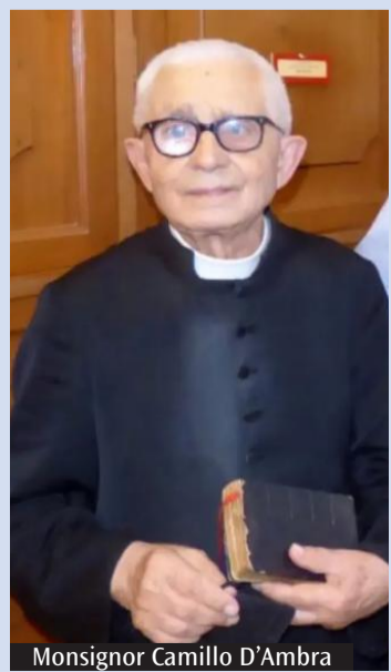
Monsignor Camillo D'Ambra