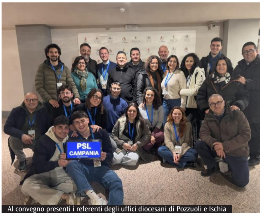
Al convegno presenti i referenti degli uffici diocesani di Pozzuoli e Ischia

Nell'era tecnologica viviamo una condizione in cui siamo apparentemente connessi ma spesso profondamente isolati. La falsa connessione può diventare spazio di manipolazione affettiva e sociale. Diventa necessario creare spazi di soglia, luoghi simbolici e reali di disarmo relazionale e di incontro umano. Generare storie significa costruire relazioni che riconoscano l'altro come presenza irriducibile. Diversi gli spunti di riflessioni che so-