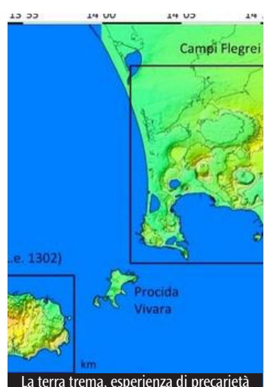
La terra trema, esperienza di precarietà